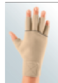
circaid® juxtafit® essentials glove