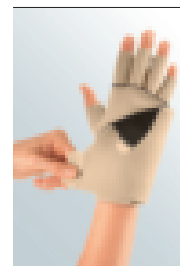
circaid® juxtafit® essentials glove with dorsum strap